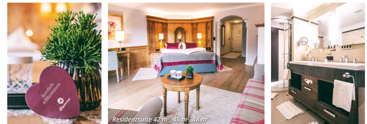
Residenzsuite 42 m 2 , 45 m 2 , 48 m 2

TIPP: Genießen Sie einen 360-Grad-Rundgang durch Ihre gewünschte Zimmerkategorie auf unserer Homepage unter www.alpenrose.at